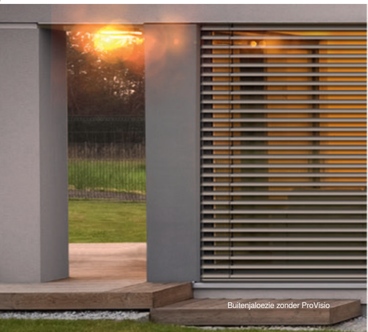
Buitenjaloezie zonder ProVisio

Een echt pluspunt op het gebied van woonkwaliteit!