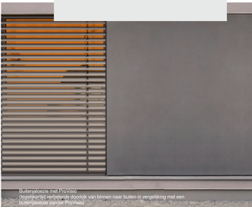
Buitenjaloezie met ProVisio (tegelijktijd verbeterde doorkijk van binnen naar buiten in vergelijking met een buitenjaloezie zonder ProVisio)