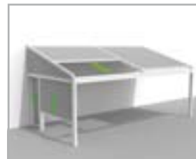
Lagune® + Triangle + Sidefix + Loggiawood® of Loggiascreen® 4FIX schuifdeur