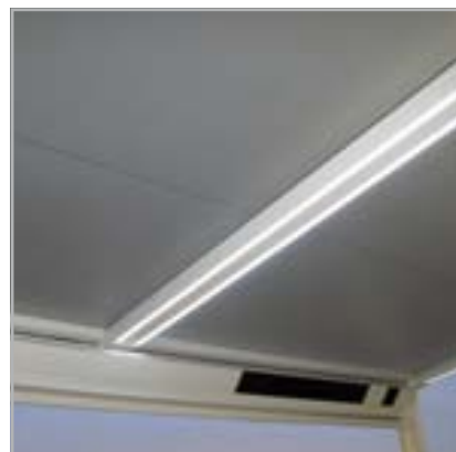
Lagune® Beam-module & Light-module

De Lagune® Beam is eveneens apart verkrijgbaar.