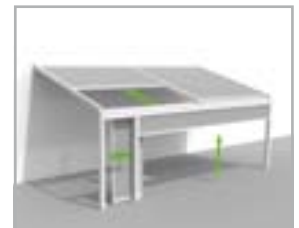
Lagune® + Frontfix + Loggiawood® of Loggiascreen® 4FIX schuifdeur