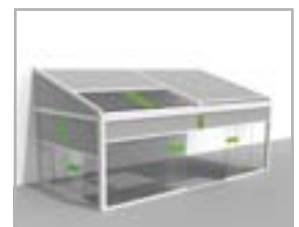
Lagune® + glazen schuifwand in combinatie met Frontfix, Sidefix