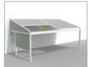
Lagune® + Triangle + meerdere Sidefix windvaste, afsluitbare zijkanten