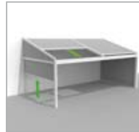
Lagune® + Sidefix windvaste, afsluitbare zijcanten