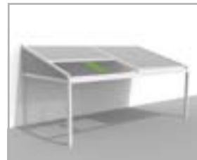
Lagune® + Triangle enkel de driehoek gesloten

Een andere look & feel kan men realiseren door integratie van de Loggiascreen® 4FIX & Loggiawood® schuifpanelen. Loggiascreen® 4FIX kan voorzien worden van hetzelfde screendoek als de verticale screens. Een warm & cosy gevoel kan bekomen worden door de Loggiawood®, schuifpanelen voorzien van WRCedar- elementen. Zij zijn de perfecte oplossing voor het creëren van een schuifdeur.