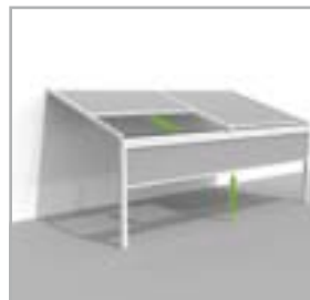
Lagune® + Frontfix windvaste, afsluitbare voorzijde