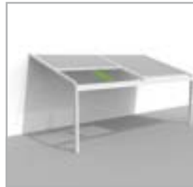
Lagune® = BASIS + Rooffix = Draagstructuur + windvast, waterdicht, lichtdoorlatend doekzonweringsdak

Voorbeelden van configuraties bij Lagune® ≤ 6m Aantal dakdelen is afhankelijk van de breedte van de Lagune®. Andere configuraties op aanvraag.