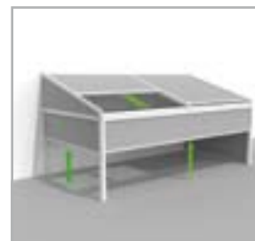
Lagune® + Frontfix + Sidefix windvaste, afsluitbare voorzijde en zijcanten