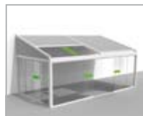
Lagune® + glazen schuifwand in voorzijde en/of zijkanten