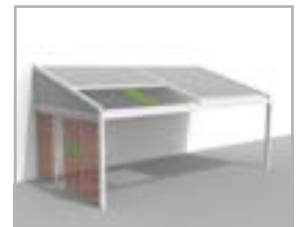
Lagune® + Triangle + Loggiawood® of Loggiascreen® 4FIX schuifpanelen