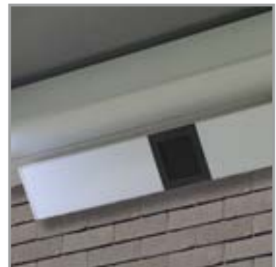
MUZIEK IN BEAM-MODULE