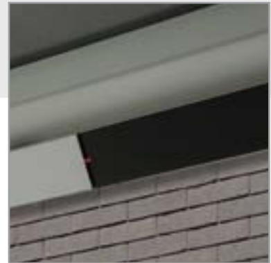
VERWARMING IN BEAM-MODULE